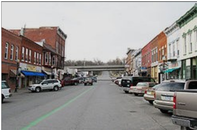
Calle en el Centro de Columbus Junction.

El sitio turístico más famoso es el puente oscilante, construido en 1886. La población estimada del pueblo es de 2,000 habitantes, de los cuales aproximadamente la mitad son de origen hispano. Las dos organizaciones más importantes en la comunidad son: el distrito escolar, y la fábrica de Tyson.